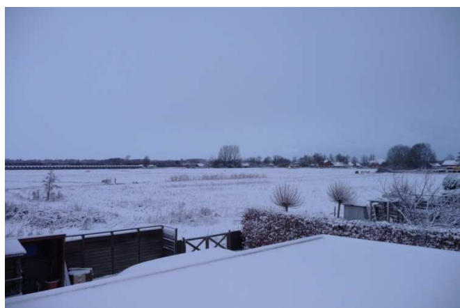
Zicht op gebied waar Haarzicht gebouwd moet worden